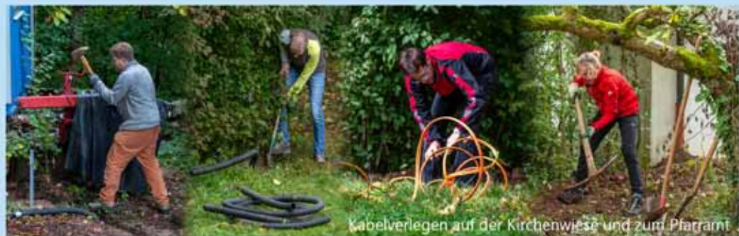
Kabelverlegen auf der Kirchenwiese und zum Pfarramt