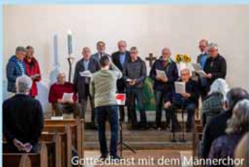
Gottesdienst mit dem Männerchor